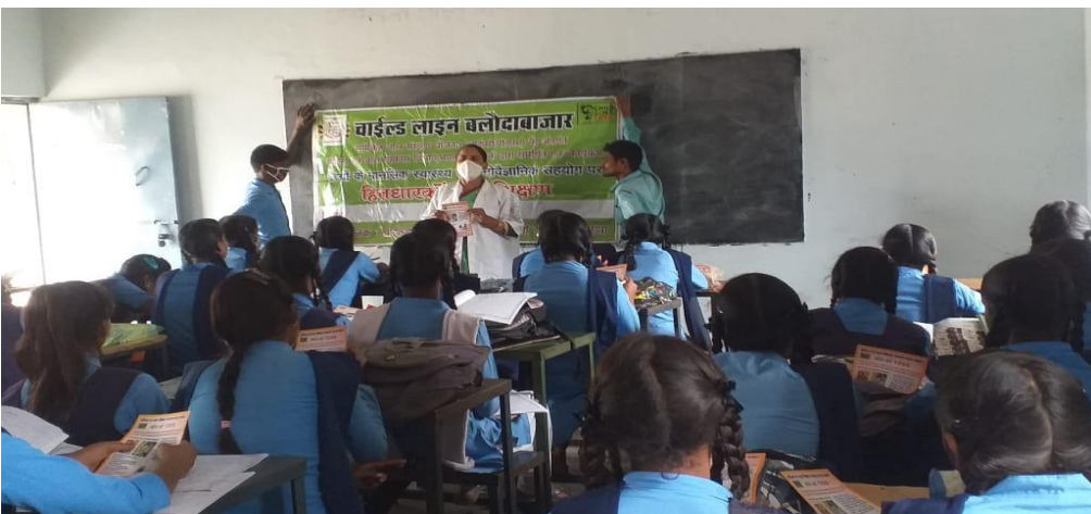
ग्राम पंचायत पौंसरी मानसिक स्वास्थ्य एवं जागरूकता कार्यक्रम