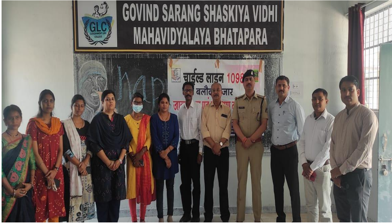
भाटापारा जागरूकता कार्यक्रम