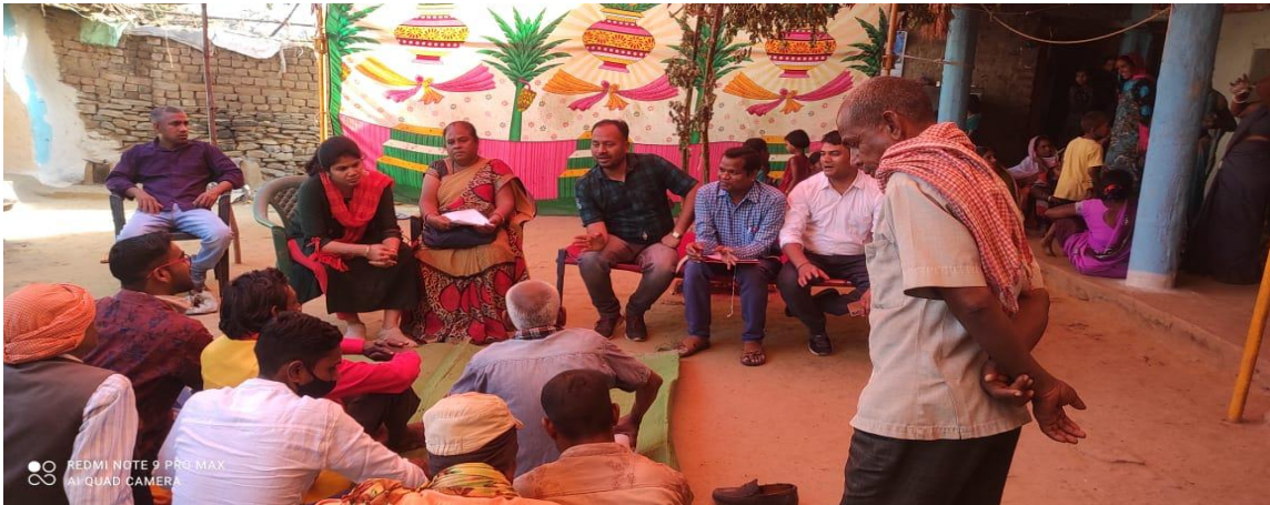
बाल विवाह —: दिनांक 08.03.2022 ग्राम पंचायत खैरी

चाईल्ड लाईन को बाल विवाह की जानकारी मिलने के पश्चात बाल कल्याण समिति व आई सी पी.एस को जानकारी देते हुए एक टीम गठित किया जाता है जिसके बाद उस क्षेत्र के थाने में सम्पर्क कर बाल विवाह होने की जानकारी देते हुए पुलिस टीम ले कर बताए गए पते पर पहुंच कर बाल विवाह हो रहे बालक /बालिका के उम्र सत्यापन करने हेतु उनके दस्तावेजों की जांच कर देखा जाता है जिसमें बालक/बालिका की उम्र कम पाई जाती है तो परिजनों को समझाइस देते हुए बाल विवाह रूकवाया जाता है ।पालको को सही उम्र की जानकारी देते हुए बाल विवाह एक कानूनन जूर्म है व एक लाख जुर्माने सहित 2 वर्ष की सजा का प्रावधान है साथ ही शादी में आए हुए अतिथियों को भी सजा का प्रावधान है।