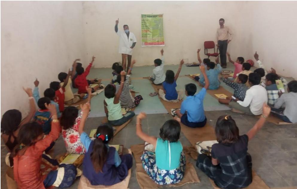
रवान में जागरूकता कार्यक्रम