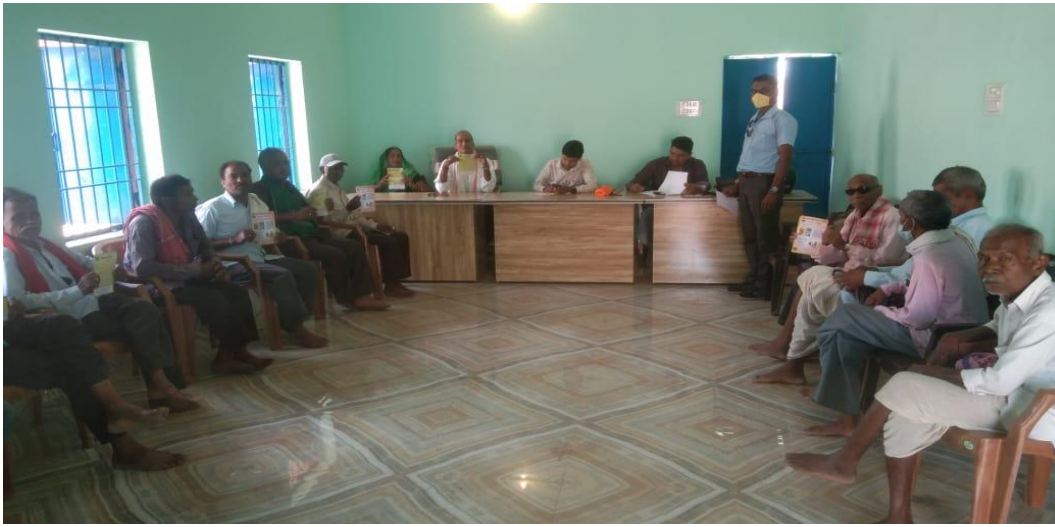
ग्राम पंचायत मटिया में पटवारी ,सरपंच ,सचिव के साथ ब