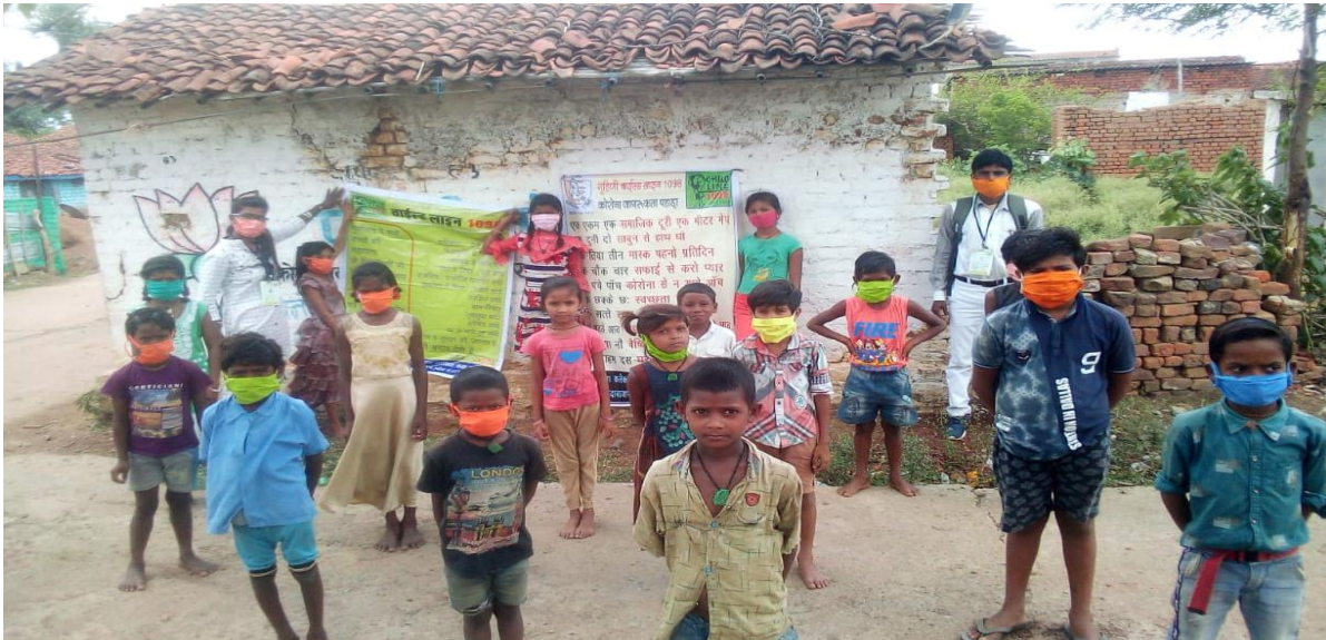
कोरोना काल में चाइल्ड लाइन द्वारा मास्क वितरण