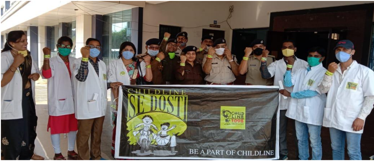
चाइल्ड लाइन से दोस्ती सप्ताह