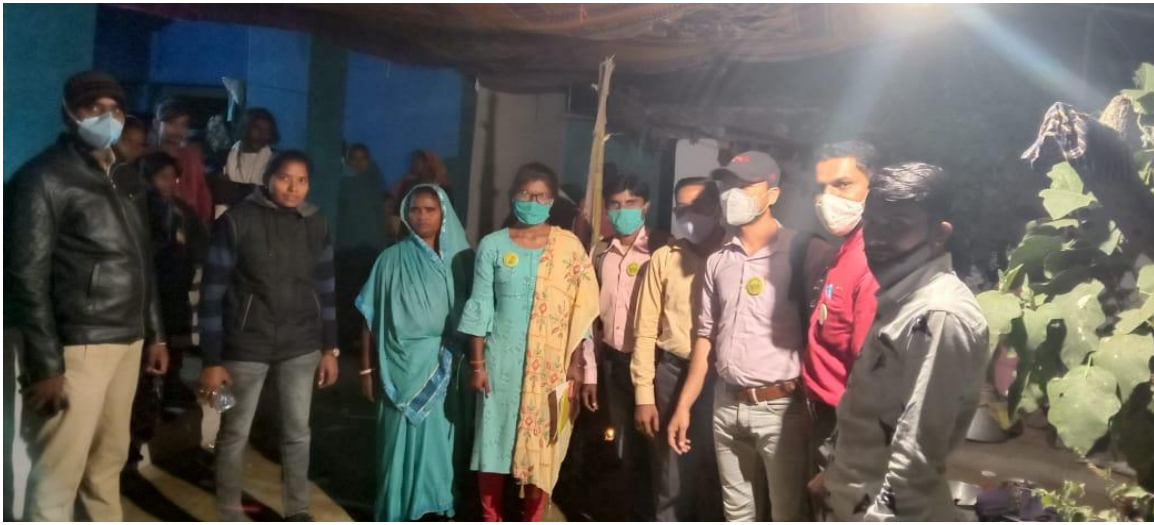
बाल विवाह ग्राम – बनसांकरा पोस्ट, थाना–सिमगा , जिला– बलौदाबाजार (छ.ग.)