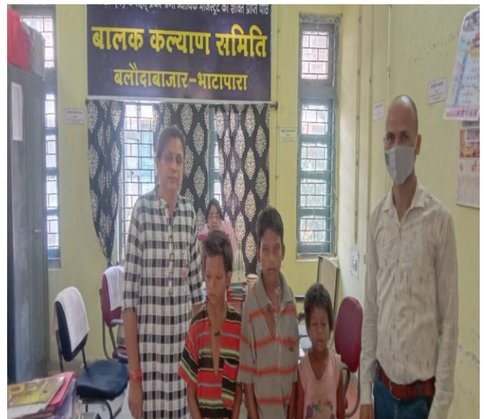
बालक कल्याण समिति में प्रस्तुत बच्चे