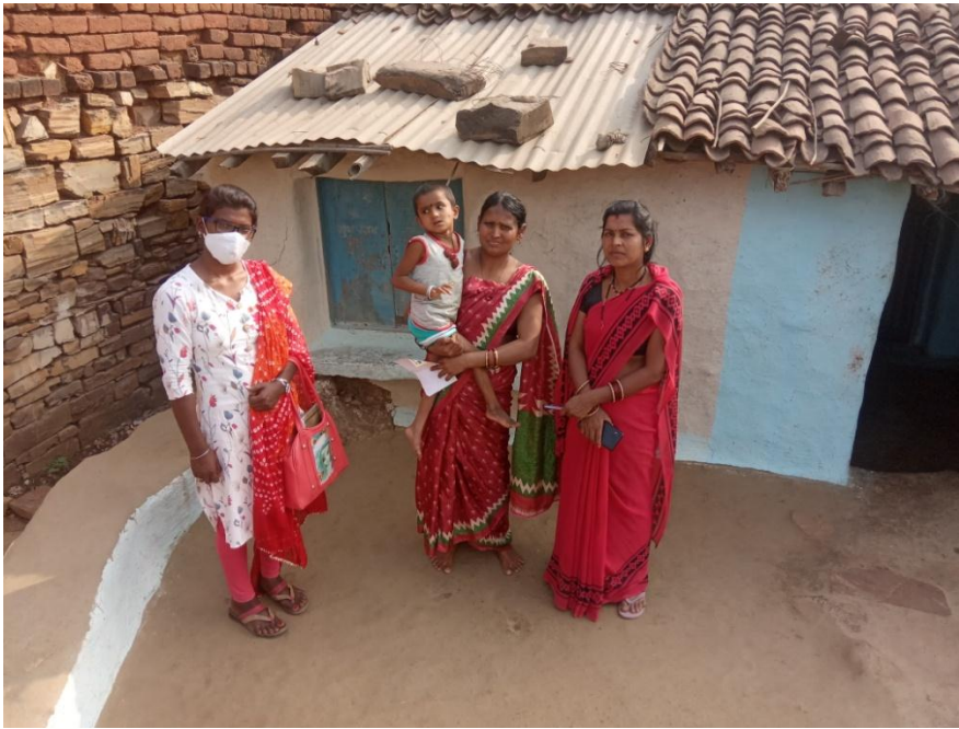
कडार के बालक का मेडीकल कराया गया